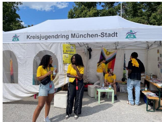
Awareness-Stand „Oben-Ohne“-Festival 22.07.2023