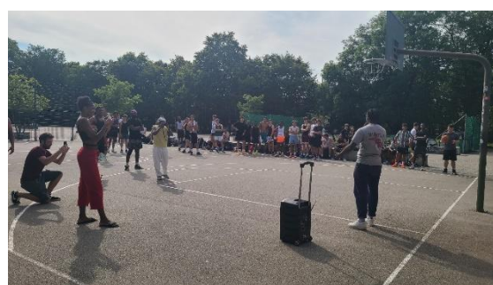
6th Man Basketballturnier, 28.06.2024