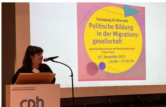
Fachtag Diversität, 07.12.2022

Ein Bewusstsein für Diversität bedeutet Vielfalt wertzuschätzen, aber nicht die Augen davor zu verschließen, dass mit verschiedenen Identitäten, Hintergründen und Biografien auch unterschiedliche Möglichkeiten und Zugänge sowie Diskriminierungserfahrungen verbunden sind. Verschränken sich verschiedene Diversitätsmerkmale in einer Person, geht dies oft einher mit ganz spezifischen Erfahrungen: Eine Schwarze junge Frau stößt auf andere Barrieren in ihrem Leben, als eine weiße junge Frau oder ein Schwarzer junger Mann.