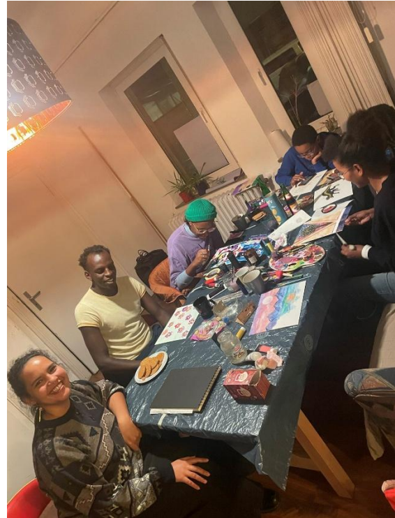
Black Community Kreativ-Abend, 14.11.2023

Die Fachstellen veranstalteten in den vergangenen drei Jahren bayernweit verschiedene Workshops und Vorträge, um einen Teil zur Demokratiebildung in der Jugendarbeit beizutragen, beispielsweise zu den Themen rechtspopulistische Sprache, Rechtsextremismus, den Ergebnissen der sogenannten Mitte-Studie 1 oder zur Europawahl im Juni 2024.