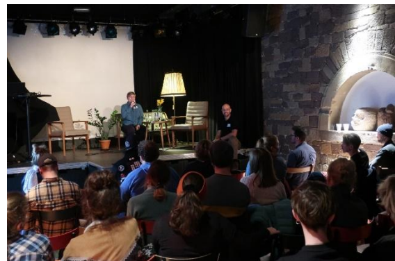
Fachtag: Klassismus & Jugendarbeit, 05.10.2022