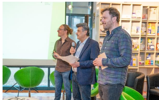
Fachgespräch zu Jugendgewalt, 15.03.2024