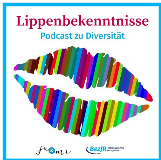
Gesprächsreihe zu Diversitäts-Themen (7 Folgen)

Veränderung, Verunsicherung, Aufnahme und Ausgrenzungen, Bereicherungen und Konflikte sind Phänomene im Zusammenhang mit Migration. Diese sind längst Teil der jugendlichen Lebenswelten in Bayern. Für die Jugendarbeit ergeben sich daraus neue Themenfelder, die nicht ignoriert werden dürfen. Die ju&mi-Fachstellen haben diese Themen angesprochen, Unterstützung und Begleitung angeboten und zu Austausch und Fortbildungen eingeladen.