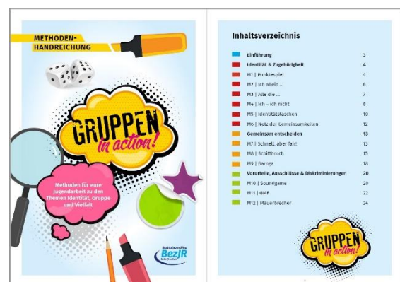
Gruppen in action! – Neue Methodenhandreichung für die Jugendarbeit

Die Situation hat sich bis heute weder in den Herkunftsländern noch an den Grenzen Europas entschärft. Es ist davon auszugehen, dass die Teilhabe junger Geflüchteter weiterhin eine Herausforderung für die Jugendarbeit bleiben wird. Gleichwohl sind bereits jetzt viele junge Menschen mit Fluchterfahrung Teil unserer Gesellschaft und werden es auch in den kommenden Jahren bleiben.