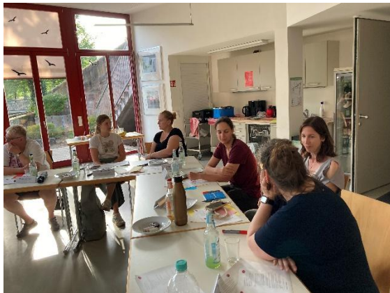
Barrierearme Öffentlichkeitsarbeit, 22.06.2023