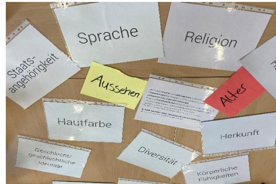
Vielfalt in die Jugendarbeit, 25.03.2023