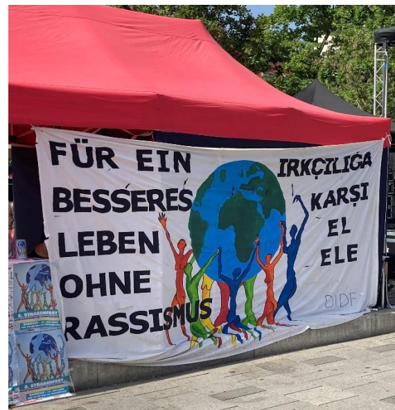
Straßenfest gegen Rassismus, 18.06.2022