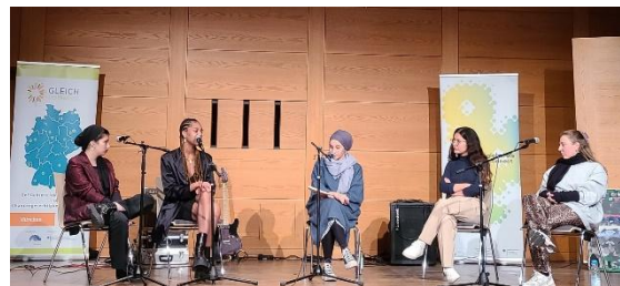
Stay Strong – Arts, Politics & Mental Health, 12.11.2023

In diesen vertrauten Kontexten konnten Jugendliche Kontakt mit Jugendarbeit aufnehmen, wo die sonst oft üblichen Komm-Strukturen nicht greifen. Es ging vielmehr darum, auch aufsuchende Angebote zu entwickeln. So wurden beispielsweise auf struktureller Ebene Gremien eingerichtet und besucht, wie z.B. die „Kommission Jugendarbeit und junge Geflüchtete“ in Nürnberg und die „Fachrunde zur Koordinierung von Angeboten für Geflüchtete“ in München, bei der sich die verschiedenen Akteur:innen regelmäßig austauschten. Dabei entstanden Kontakte zu Asylsozialdiensten, Ehrenamtsprojekten oder Jugendmigrationsdiensten vor Ort, die mit Jugendverbänden und Freizeiteinrichtungen in Kontakt gebracht wurden.