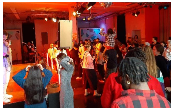
Open Hearts – Open Minds, World Refugee Day, 21.06.2024