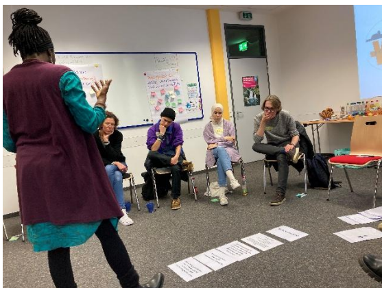
Wie geht das mit dem Antirassismus?, 17.11.2022

Ein notwendiger Baustein dafür kann die Demokratiebildung im Kleinen und Großen sein. Hierfür benötigen Ehrenamtliche und Hauptberufliche aber erst einmal das notwendige Wissen und praxisnahe Methoden.