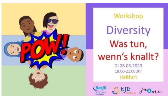
Workshop: Diversity – Was tun, wenn's knallt?