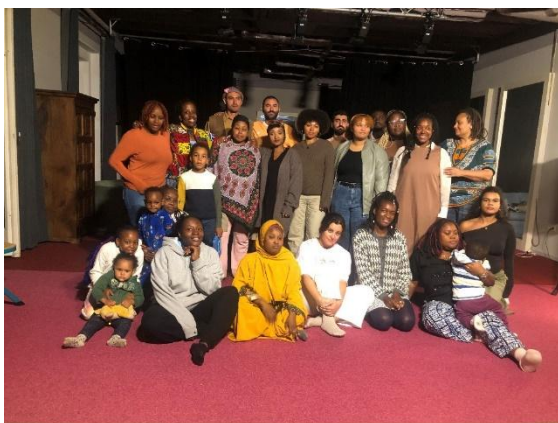
Teilnehmende am BIPOC-Wochenende, September 2024

Die Demokratiebildung ist ein essenzieller Bestandteil des Empowerments. Sie befähigt Menschen, ihre politischen Rechte und demokratischen Handlungsspielräume zu erkennen und zu nutzen. Das Ziel ist, eine lebendige Demokratie zu fördern, in der sich alle Menschen aktiv beteiligen können. Politische Interessenvertretung und die Fähigkeit, sich in politischen Prozessen einzubringen, sind hierfür zentral. Es geht darum, Wege zu finden, um Interessen und Forderungen einzubringen und eine gerechtere Gesellschaft zu schaffen.