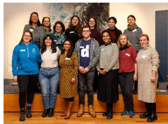
Fachtagung Diversität, 06.12.2023