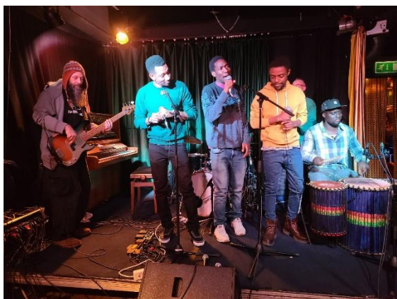
Wege der Solidarität, 15.02.2024

Der gemeinsame Anspruch der Fachstellen ist es, eine gleichberechtigte Teilhabe für junge Menschen mit Migrationsgeschichte herzustellen. Sie legten daher einen besonderen Fokus darauf, Kooperationen mit Akteur:innen aufzubauen, bei denen diese Zielgruppe bereits angedockt ist, wie beispielsweise Jugendmigrationsdiensten, Unterkünften für Geflüchtete oder migrantischen Selbstorganisationen.