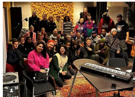
WORD UP! crew

Veranstaltungen der anderen Fachstellen dazu: